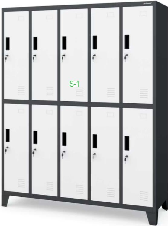
SZAFKA SOCJALNO - UBRANIOWA _ S-1 172x136x45