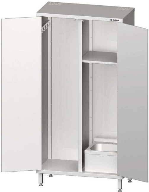
SZAFKA GOSPOD. _ S-7 200x1000x50