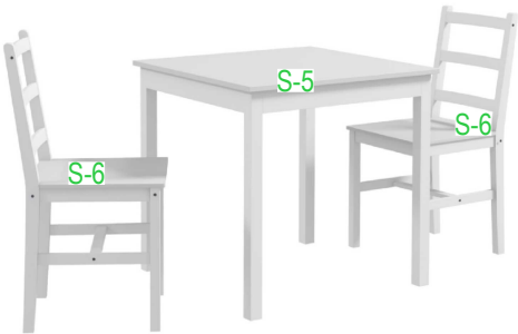
+ AKCESORIA SOCJALNE